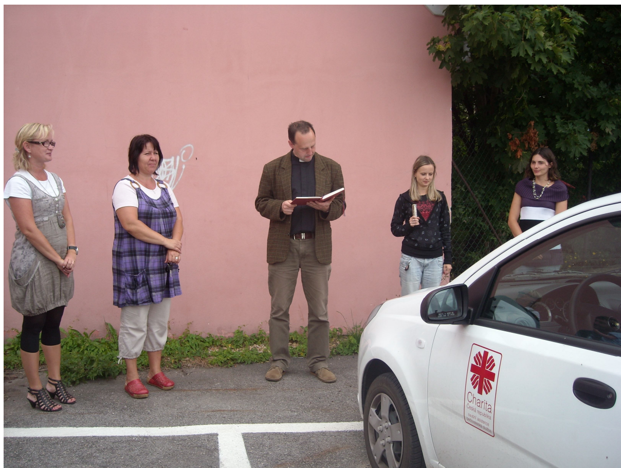
Žehnání nového automobilu pro pečovatelskou službu